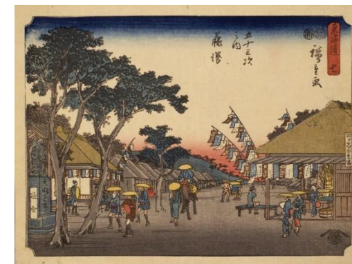
「東海道七 五十三次之内 藤沢 四ツ谷の立場 (蔦屋版)」 歌川広重