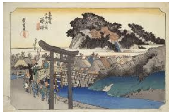
「東海道五十三次之内藤沢 (保永堂版)」 歌川広重