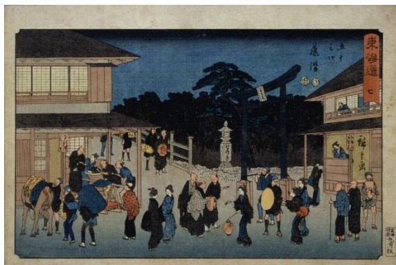
「東海道七 五十三次 藤沢 (隸書東海道)」 歌川広重