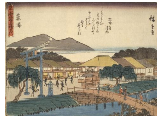
「東海道五十三次 藤沢 (狂歌入東海道)」 歌川広重