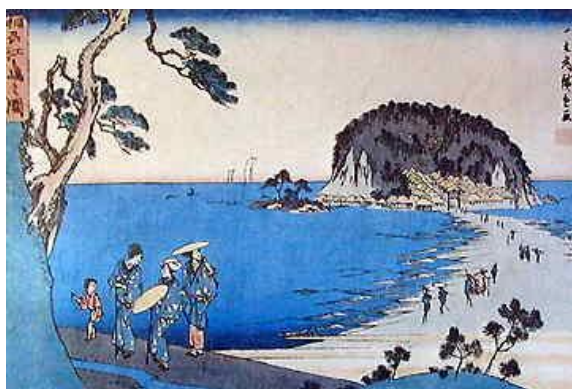
「相州江ノ島の図」 歌川広重