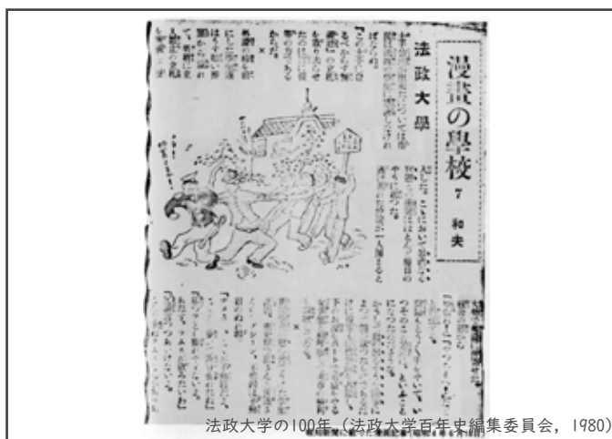
法政大学の100年 (法政大学百年史編集委員会, 1980)

大正10(1921)年、法政大学が靖国神社付近から現在の場所に移転して竣工した頃の牛込濠では、女学生がボートに乗って遊んでいた。