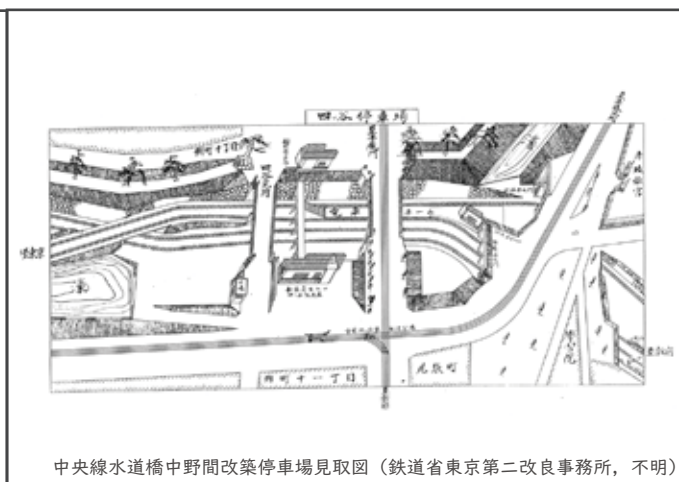
中央線水道橋中野間改築停車場見取図 (鉄道省東京第二改良事務所, 不明)

大正10(1921)年に法政大学が現在の位置に竣工して以来、法政大学の学生が土手に入り込んでおり、その様子を新聞が取り上げた。