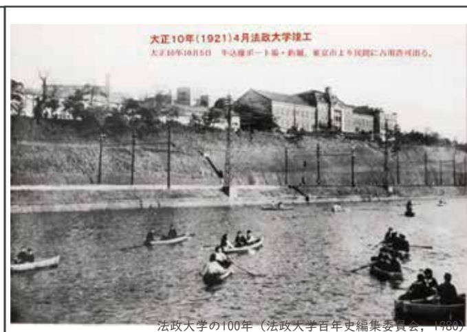
法政大学の100年 (法政大学百年史編集委員会, 1980)

明治31年頃の飯田町駅は甲武鉄道のターミナルとなり、三崎町は劇場など多くの施設が建てられた。後に水道橋や万世橋への通過点となり撤去される。