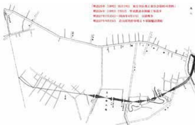
東京都市計画資料集成 第5巻（本の友社，1987）

明治 22 年，弁慶堀の上に弁慶橋が新設され，小土手の上には桜が植えられる。しかし大正 9 年に弁慶橋を壊し，濠を埋め立てる東京府計画が出される。