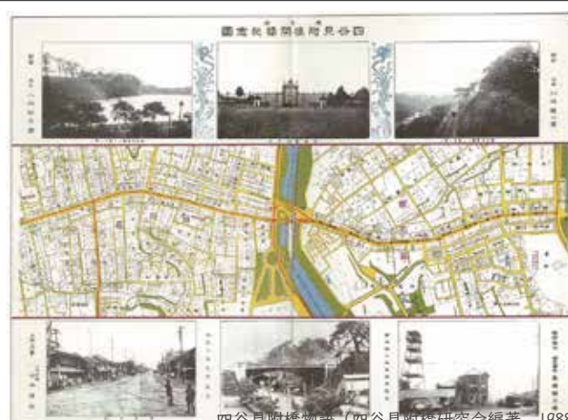
四谷見附橋物語（四谷見附橋研究会編著，1988）

明治 28 年には四ツ谷駅が開設し，現存する御所トンネルを通過している。御所トンネルは都内にあるトンネルの中で最も古いとされている。