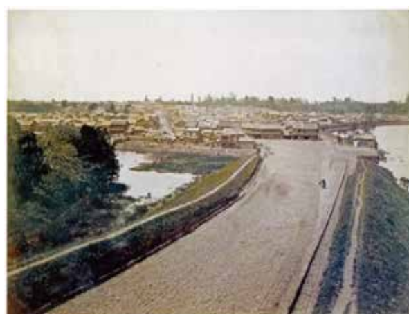
そこにあった江戸 幕末明治写真国会（上條真生共著，2018）

赤坂見附から牛込見附の間に「史跡 江戸城外濠跡」が存在するが、文化財の方が使用すると「堀」は土偏となる。江戸の古文書には土偏の「堀」しかない。