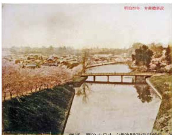
増補 明治の日本（横浜開港資料館編，2003）

明治初年，高麗門から赤坂方面にかけて土手の端には桜や樹木を植えないようにしていた。これは，軍事施設のため人が隠れるようなものを作らないためである。