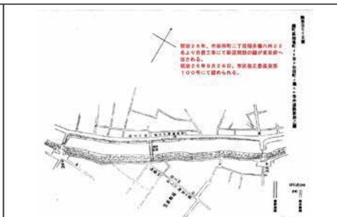
東京都市計画資料集 第6巻 (本の友社, 1987)

現在の外濠公園野球場付近であるが、堀は軍事施設として埋めないよう大切に管理されていた。また、江戸期の緑化は区域がはっきり区別されていた。