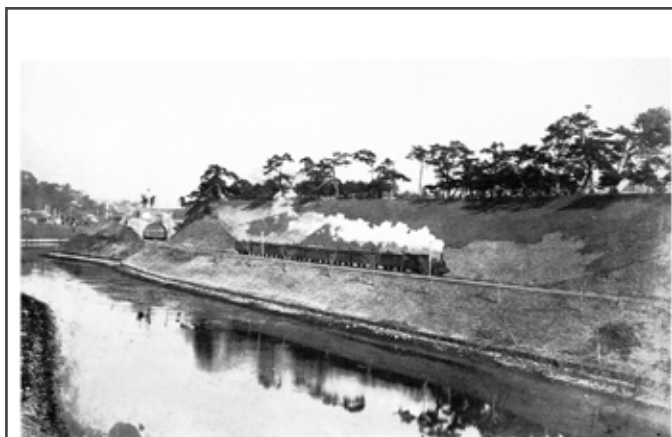
新日本鉄道史 上 (川上幸義, 1966)