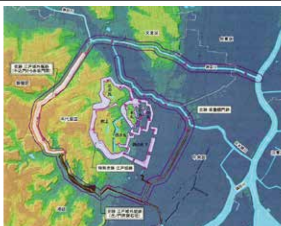
史跡江戸城外濠跡 保存管理計画書（千代田区教育委員会編集，2008）

赤坂見附から牛込見附の間に「史跡 江戸城外濠跡」が存在するが、文化財の方が使用すると「堀」は土偏となる。江戸の古文書には土偏の「堀」しかない。