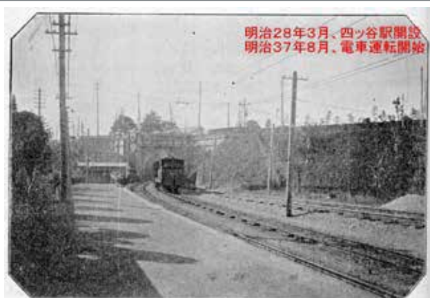
道 路 の 附 東京案内 下巻（東京市編，1907）

甲武鉄道は明治 26 年に新宿駅から代々木を経て青山練兵場を通過する市街線工事に着手した。翌年には日清戦争が勃発し，鉄道工事がタイムリーとなる。