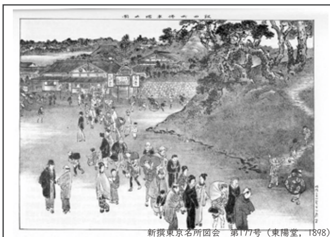
新撰東京名所図会 第177号 (東陽堂, 1898)

新見附は鉄道工事に合わせて作られた。明治26年に新道開設の願いが東京府へ出されるが、この工事は市ヶ谷二丁目の甘酒屋呉服店が仕掛けたとされる。