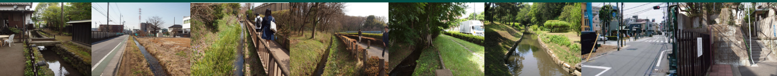
武蔵野台地に広がる分水網と多彩な関連遺構